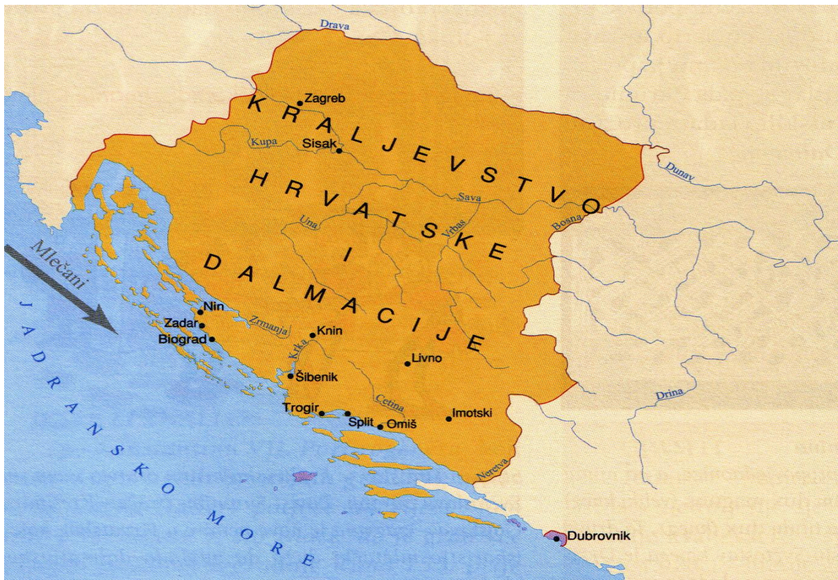
Hrvatska u drugoj polovici 11. stoljeća

je Šibenik 1066. godine. Nakon Dalmacije Petar Krešimir IV. proširio je svoju vlast na Neretvansku kneževinu, Liku i Bosnu. Sa slavonskim banom Dmitrom Zvonimirom se dogovorio će Dmitar Zvonimir postati njegov suvladar i nasljednik. Sa Hrvatskom je sjedinjena i Slavonija. Za vladavine Petra Krešimira IV. Hrvatsko kraljevstvo je imalo najveći teritorijalni opseg (jedinstven teritorij od Jadrana do Drave). Gospodarski napredak Hrvatske odvijao se kroz obnovu antičkih putova, razvoj trgovine, pomorstva, obrta.